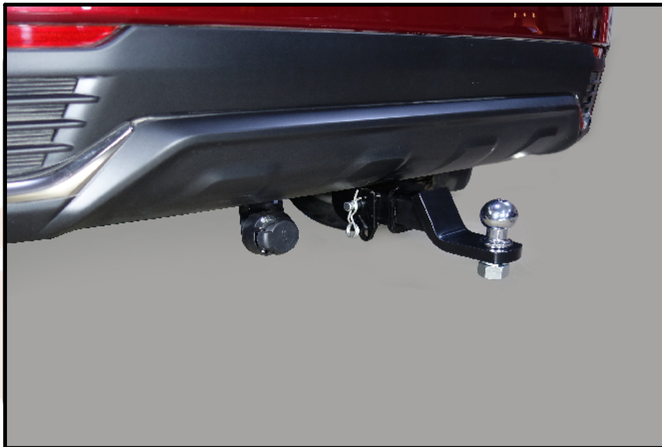
Фаркоп арт. TCU00109 TCU00109N*

TCU00109N* - обозначение комплектации фаркопа с нержавеющей шаром